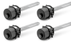
4 x CTHK 635